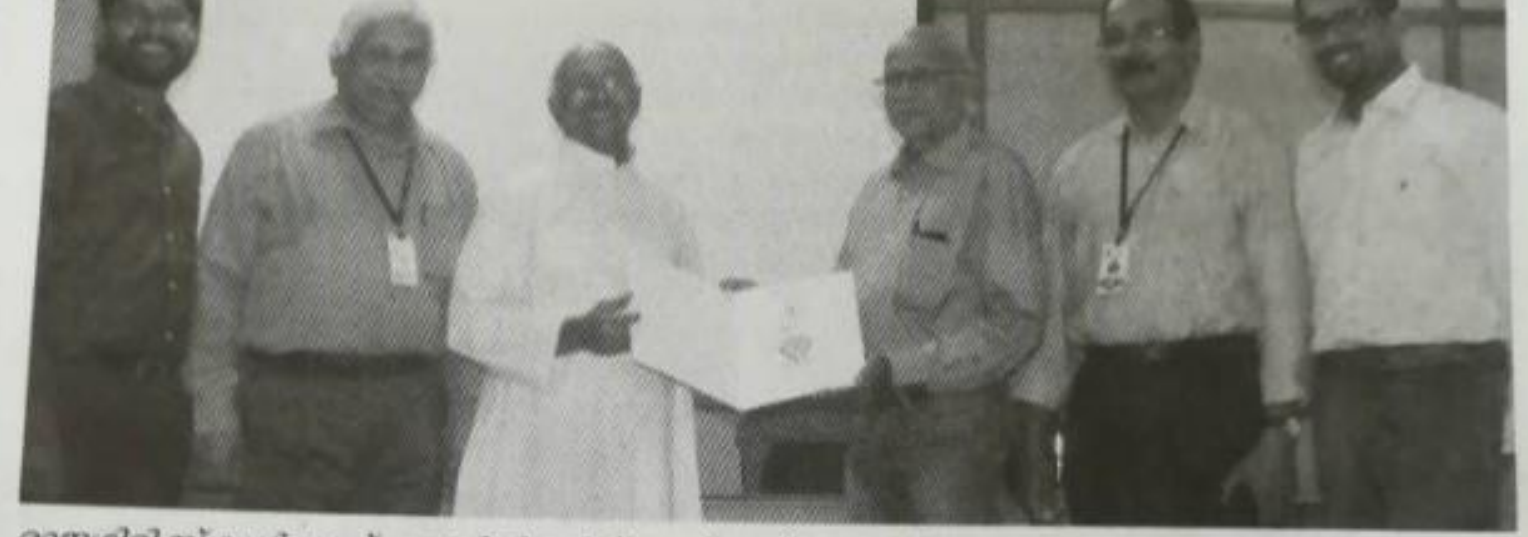
രാജഗിരി സ്കൂൾ ഓഫ് എഞ്ചിനിയറിങ് ആന്റ് ടെക്നോളജിയും എ.ടി.ഡബ്ല്യു.ഐ.സി റിസർച്ച് ആ ൻഡ് ഡവലപ്പുമെന്റ് പ്രൈവറ്റ് ലിമിറ്റഡും പരസ്പര സഹകരണം ലക്ഷ്യമിട്ട് കരാറിൽ ഒപ്പുവച്ചപ്പോൾ