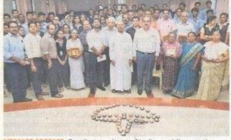
MESSAGE OF PEACE: Family members of Indian soldiers at the Rajagiri School of Engineering and Technology on Friday.

Peace Mantras, an event jointly organised by the Sainik Welfare Board and the alumni association of Rajagiri School of Engineering and Technology to bring together martyrs' families, threw up such a lofty idea here on Friday. "The pain of losing near and dear ones is the same everywhere. It is no different even in a country that is perceived as an enemy. Enmity should end, and to promote such a cause, we are willing to visit Pakistan," family members of martyrs said in an emotionally charged atmosphere.